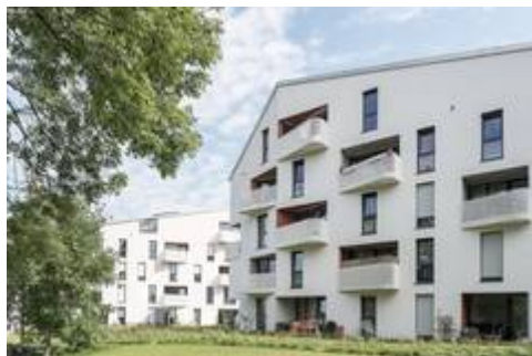
Wohnquartier Ludwigshöhe Kempten von f64 Architekten

Bezahlbarer Wohnraum wird akut gebraucht. Auch in Kempten stand die Stadtentwicklung vor der Aufgabe, einerseits Wohneigentum bereit zu stellen und andererseits bezahlbare Mietwohnungen zu schaffen. Die f64 Architekten haben genau dies im Auftrag der Bau- und Siedlungsgenossenschaft Kempten in einer architektonisch höchst eindrucksvollen Weise umgesetzt.