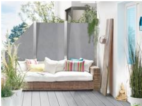
Dauerhafte Schönheit: Das neue System Board Keramik von Brüggmann TraumGarten in moderner Zementoptik vereint Natürlichkeit mit außergewöhnlicher Robustheit.

Natürliche Optik gepaart mit außergewöhnlicher Robustheit und kinderleichter Pflege – das bietet die neue Sichtschutz- und Zaunfeldserie System Board Keramik von Brüggmann TraumGarten.