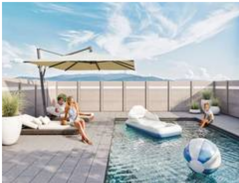
Sichtschutzzäune aus Aluminium und Glas werden immer beliebter, mit ihnen lassen sich attraktive Terrassen und gemütliche Sitzcken gestalten, aber auch lästige Blicke und Straßenlärm abhalten.

Wer bei seiner Grundstückseinfriedung neben ein paar Grundregeln auch auf Qualität und perfekte Planung achtet, wird lange Freude daran haben. Dann klappt es auch mit dem Nachbarn.