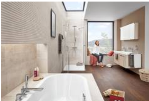
Das Badezimmer kann luxuriöse Wellnessoase, barrierefreie Badelandschaft oder zweckmäßige Nasszelle sein. Entscheidend ist, dass Flächen sinnvoll ausgenutzt werden.

Ein Badezimmer ist perfekt, wenn es den individuellen Lebensbedürfnissen Rechnung trägt und rundum den persönlichen Vorstellungen entspricht. Die Traditionsmarke DIANA holt ihre Kunden genau dort ab, wo sie stehen und begleitet sie von der ersten vagen Idee bis zum fertigen Traumbad.