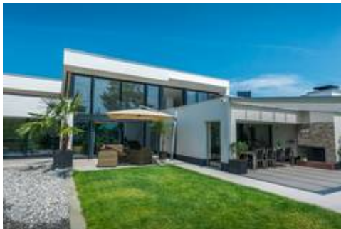
Freiarmschirme liegen im Trend. Sie sind nicht nur platzsparend, schützen vor Regen, Sonne, Wind und unliebsamen Blicken Dritter, sondern lassen sich auch nah an Hauswänden platzieren.

Nichts ist schöner als die Sonne im Schatten zu genießen. Ob großzügige Terrasse oder gemütliche Gartenlounge – wer die Outdoorfläche unter einem Sonnenschirm komplett ausnutzen möchte, ist mit einem Freiarmschirm gut beraten. Dank eines Seitenmasts, an dem das Schirmdach fixiert ist, beansprucht ein Freiarmschirm wenig Platz, steht nichts und niemandem im Weg und bietet größtmöglichen Schatten.