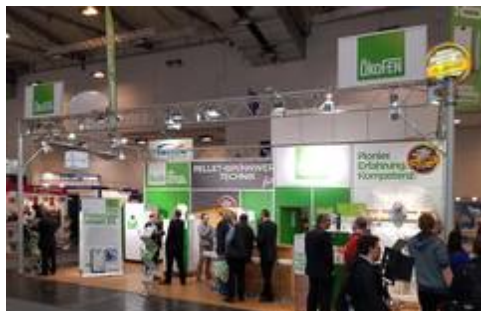
Auf den diesjährigen Fachmessen SHK Essen und ifh/Intherm Nürnberg präsentiert Pelletkesselspezialist ÖkoFEN Produktlösungen zum zeitsparenden Einbau und informiert über die hochattraktive Förderung beim Kesseltausch.

Auf den diesjährigen Fachmessen SHK Essen und ifh/Intherm Nürnberg präsentiert ÖkoFEN Produktlösungen zum zeitsparenden Einbau und informiert über die hochattraktive Förderung beim Kesseltausch. Im Mittelpunkt stehen ein effizienter Beistellwärmespeicher als Pufferalternative und die Pellematic Condens in der Leistungsgröße 22-32 kW. Mit umfassenden Serviceangeboten unterstützt ÖkoFEN zudem das Fachhandwerk, die einer erhöhten Nachfrage nach umweltfreundlichen Lösungen entgegenblicken.