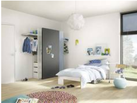
raumplus »mobile« lässt sich als platzsparender Kleiderschrank im Jugendzimmer verwenden.

Aufgrund steigender Mieten wächst der Bedarf an Wohnungen mit einer geringeren Fläche kontinuierlich. Die Experten von homesolute.com wissen, moderne Möbel und Einrichtungsgegenstände passen sich den veränderten Ansprüchen an und sparen sogar Platz.