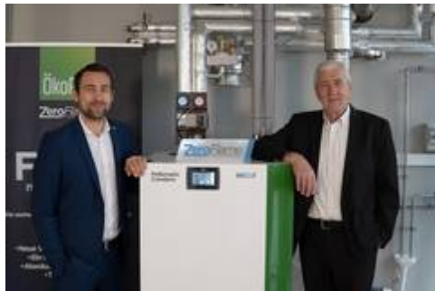
Weltpremiere – ÖkoFEN hat das Feuer neu erfunden und ermöglicht mit der ZeroFlame®-Technologie Flammenlose Wärme aus Pellets.

Mit ZeroFlame®, der neuen Pellet-Verfeuerungstechnologie, kann ÖkoFEN nach mehrjähriger Forschungsarbeit einen weiteren Meilenstein im Bereich des Heizens mit Holzpellets vorstellen. Abhängig von der Entwicklung der Pandemielage soll die neue Pellematic Condens mit ZeroFlame®-Technologie dem Fachpublikum im Juli 2021 im Rahmen einer Roadshow mit 30 Standorten präsentiert werden.