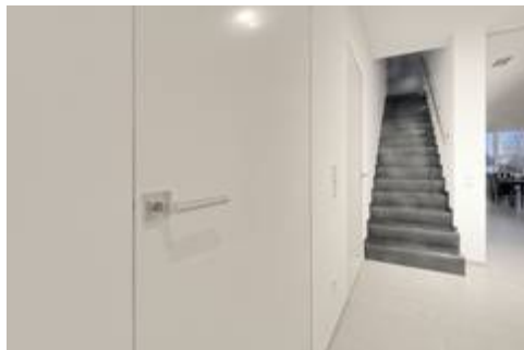
Innenraumtüren, die bündig mit der Wand eingebaut sind, verleihen einem Raum eine ganz besonders Note.

Ein anhaltender Trend der Raumgestaltung ist die minimalistische und puristische Geradlinigkeit. Die Reduktion auf das Wesentliche vermittelt den Bewohnern Ruhe und Entspannung. Ein entscheidender Faktor für die Raumwirkung sind die Innenraumtüren.