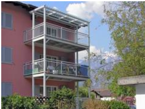
Der Balkonanbau mit Stützen erlaubt auch den nachträglichen Anbau mehrerer Balkone und ist damit vor allem für Mehrfamilienhäuser eine ideale Lösung.

Sobald die Sonne scheint, heißt es: nichts wie raus! Schnell wird dann der eigene Balkon zum Lieblingsplatz. Für alle, die bisher darauf verzichten mussten gilt: ein nachträglicher Balkonanbau ist fast immer möglich.